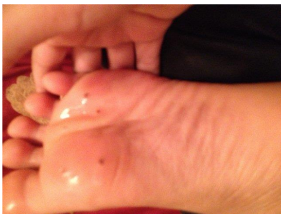
Через один месяц после начала лечения